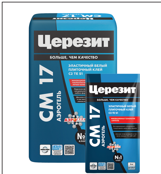
ЦЕРЕЗИТ_СМ 17 АЭРОГЕЛЬ_11.2024

Смесь сухая строительная клеевая С2 TE S1, ГОСТ Р 56387