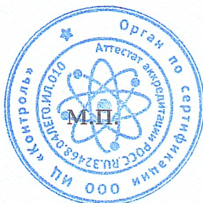
СХЕМА СЕРТИФИКАЦИИ 1с (ГОСТ Р 53603-2020. Оценка соответствия. Схемы сертификации продукции в Российской Федерации).