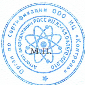
СХЕМА СЕРТИФИКАЦИИ 1с (ГОСТ Р 53603-2020. Оценка соответствия. Схемы сертификации продукции в Российской Федерации).