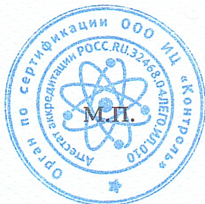
СХЕМА СЕРТИФИКАЦИИ 1с (ГОСТ Р 53603-2020. Оценка соответствия. Схемы сертификации продукции в Российской Федерации).