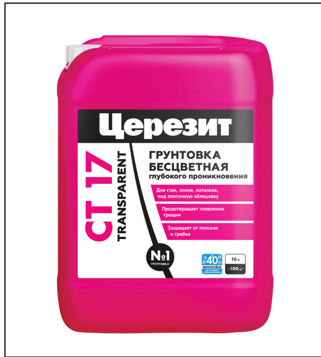
ЦЕРЕЗИТ_СТ 17 Transparent_10.2024

Перед применением тщательно перемешать или взболтать содержимое емкости. Грунтовку наносят кистью или вали-